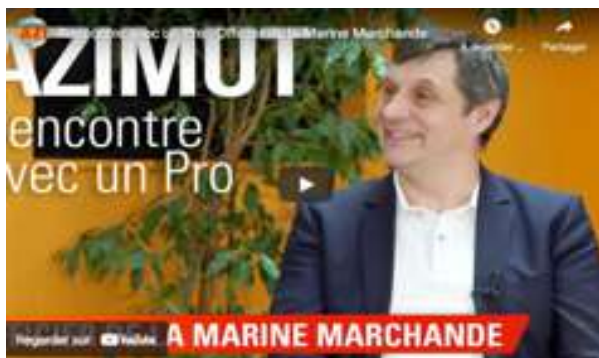
# Salon AZIMUT