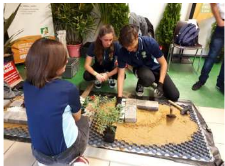
# Place Ô Gestes - Pays de Retz