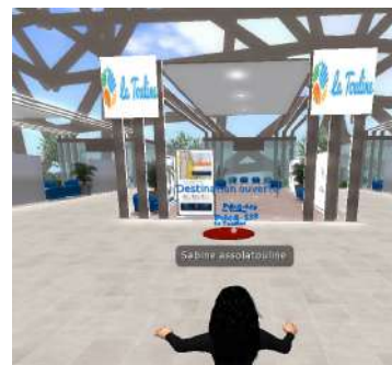
# Métierama virtuel