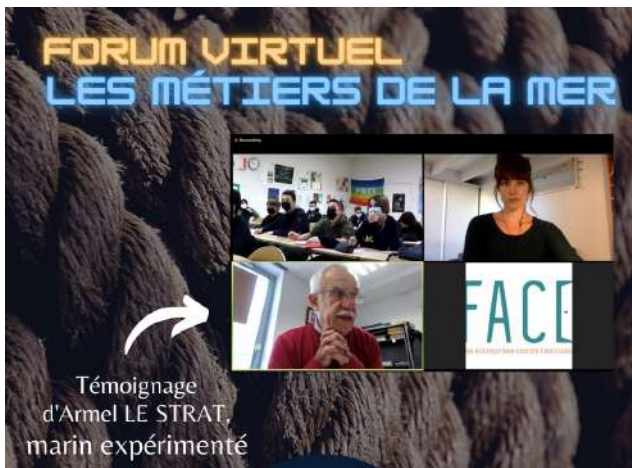
# Collège de Saint Victoret